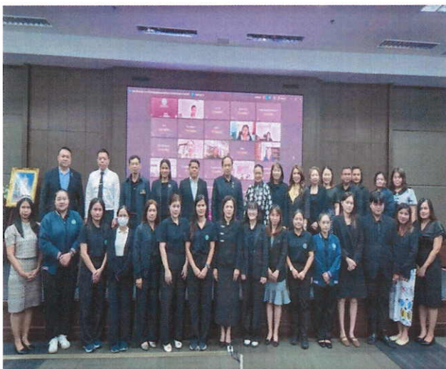
รางวัลองค์กรคุณธรรมต้นแบบ กรมสนับสนุนบริการสุขภาพ ปีงบประมาณ พ.ศ. 2568